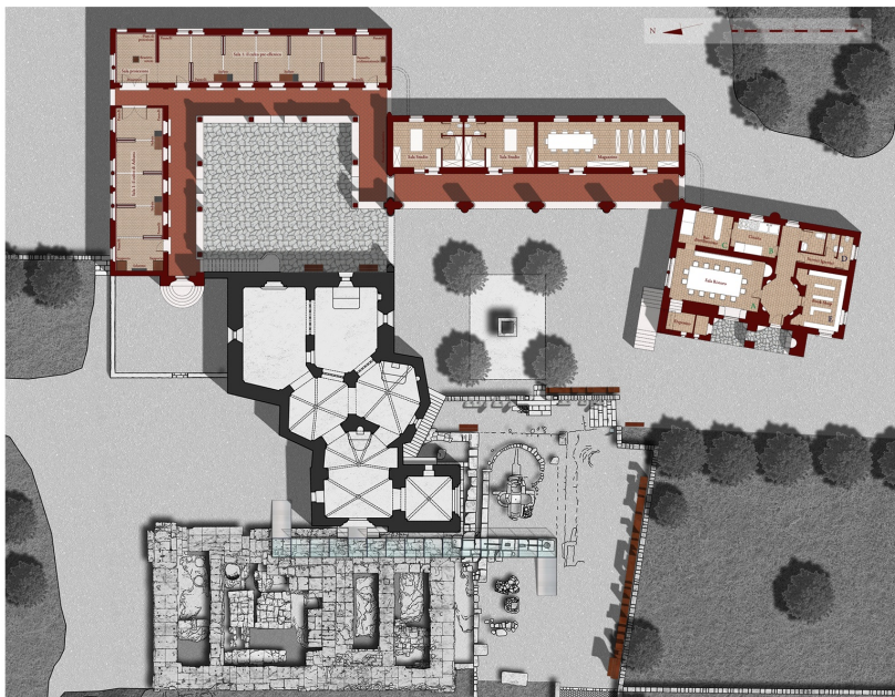
Allestimento museografico: pianta del piano terra