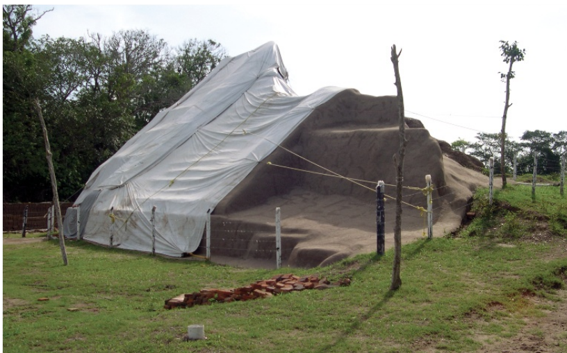
Sito archeologico di La Joya, Veracruz, Mexico. Protezione mediante l'applicazione di uno strato di sacrificio.