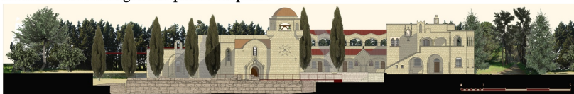
Prospetto occidentale del monastero