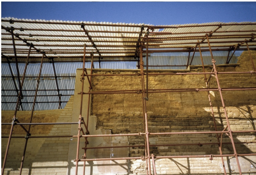
Gela (CL). Mura di Capo Soprano. Intervento di restauro in corso di realizzazione.