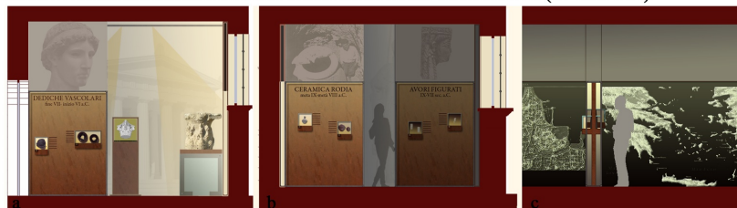
Antiquarium: a. sala culto poliade, b. sala culto pre-ellenico, c. dettaglio vetrina